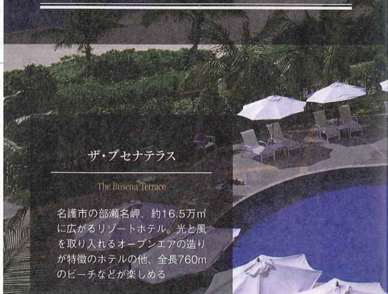
ザ・ブセナテラス

非日常的な時間と空間を楽しむホテルだが、その究極は都心から遠く離れたリゾートホテルだ。自然豊かな環境に包まれながら体だけでなく、心もリフレッシュしてみたいかがだろうか。