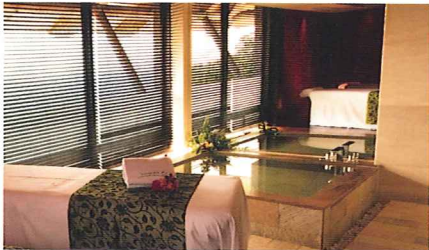
(上)島の食材から創られた、カジュアルフレンチが食せる「ayana」。(中)スパ用トリートメントルームは、南国のムード香るアンモダンな空間。芳しいハーブの香りが身も心も癒していく。(右/上)「sankara」本館の頭上に輝く星々。都会の空に慣れた眼には、詭やかな驚きを与えることだろう。(右/下)高台のプールサイドからは、朝の陽光に煌めく海が見渡せる。