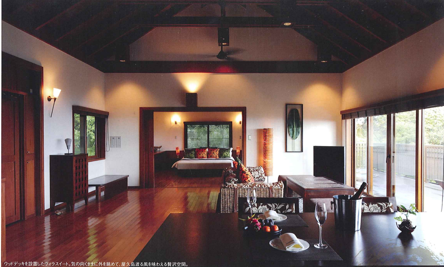
ウッドデッキを設置したヴィラスイート。気の向くままに外を眺めて、屋久島渡る風を味わえる贅沢空間。