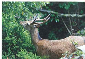
(上)屋久島の固有種「ヤクシカ」。時折森の木々の隙間からその愛らしい顔をのぞかせる。(右)太古からの命の営みが受け継がれている屋久島の森。木々の隙間から注ぐ木漏れ日に朝露が輝く様は幻想の世界にいるかのようだ。

☎0800-800-6007 ☎鹿児島県熊毛郡屋久島町麦生字萩野上553 🕒IN15:00~OUT13:00 📞各種可 💰¥62,000円~👉29台 🚗屋久島空港から車で約40分(無料送迎有) 🌐http://www.sankarahotel-spa.com/