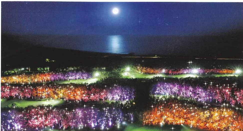
LED照明で雄大な松林を照らす「トム・ワトソンゴルフコース」のイルミネーション。