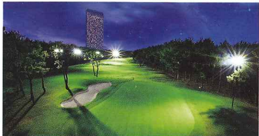
「トム・ワトソンゴルフコース」は、夜もプレイできる「ホシゾラ★ゴルフ」が評判(5,000円〜)。