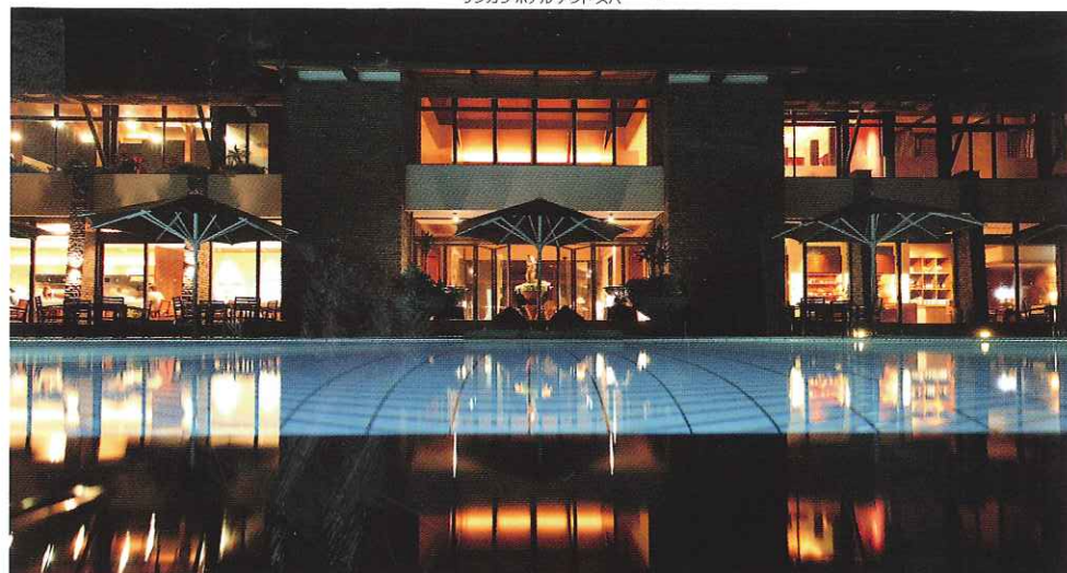
海を望む高台の隠れ家のような佇まい。プール、スパ、フットック&amp;ライブラリーなど癒しの施設も各種。