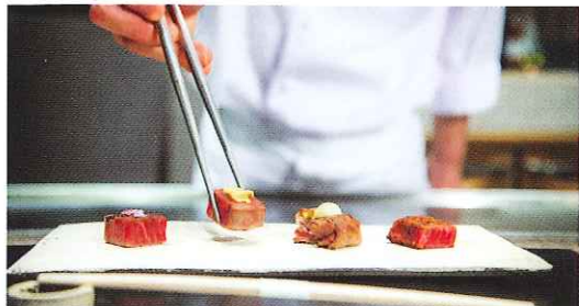
小山薫堂氏プロデュース、6席だけの牛肉割烹店「Beef Atelierうしのみや」では宮崎牛を堪能できる。

地上154m、45階層のプリズム型の建物に743部屋を有する「シーガイア」のフラッグシップホテル。全室オーシャンビューの客室は、洋室、和室などを含めたバリエーション豊富なラインアップで、スタンダードタイプの部屋でも50㎡以上というゆとりの空間。果てしなく続く水平線を眺めながら、ただのんびりと過ごせる、憧れのリゾートホテルです。木漏れ日が差す緑の道を歩く、宮崎の食材に手間ひまかけた料理で舌鼓をうつ、そしてゆっくり休んでしっかりと遊ぶ。本物が生み出す上質な時間に、きっと心の奥底まで癒されるはず。都心から離れた宮崎に足を運び、忙しい都会の日常を忘れて、羽を伸ばしてみたいかが。