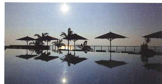
プールサイドにはプールサイドデッキが、ドリンクや軽い食事を頼んでラグジュアリーな気分を。