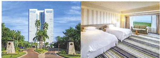
南国のリゾートムードのなかに建つホテルの佇まいは荘厳。