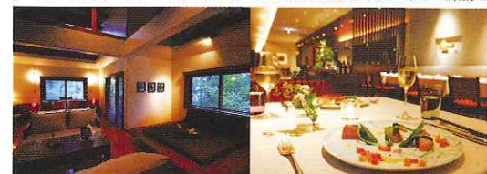
森に点在するヴィラタイプの「サンドラヴィラ」。